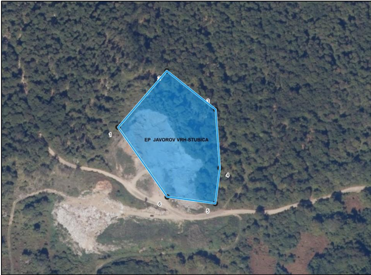
Grafički prikaz eksploatacijskog polja tehničko-građevnog kamena “Javorov vrh-stubica”